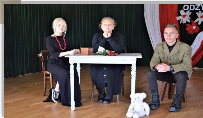
Fot. Fragment występu „Ta co nie zginęła”