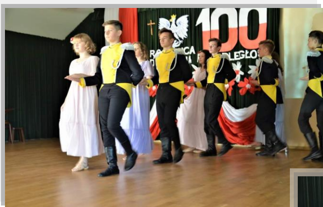
Fot. „Polonez czas zacząć”- tańczą uczniowie naszej szkoły.

Były to gminne obchody Święta Niepodległości połączone z odsłonięciem tablicy pamiątkowej przed Urzędem Gminy w Dzikowcu.