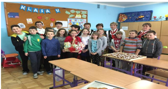
Fot. Projekt „Magia Świąt Bożego Narodzenia”

Zespół Szkolno-Przedszkolny Nr 1 w Mechowcu uczestniczył również w wielu projektach. Jednym z nich były wyjazdy na lekcje pływania na pływalnię Fregata w Kolbuszowej- projekt realizowany przez Stowarzyszenie Rozwoju Gminy Dzikowiec " Nasza Szansa". Ponadto uczniowie naszej szkoły brali udział w imprezach organizowanych przez grono pedagogiczne, takich jak: -" Czego nie wiesz o Kosmosie" i wyjazd do Śląskiego Planetarium w Chorzowie -projekt w ramach Akademii Kreatywności Regionalnej Fundacji Rozwoju "Serce" w Kolbuszowej konkurs matematyczny z okazji „Światowego Dnia Tabliczki Mnożenia” - projekt pt. „Magia Świąt Bożego Narodzenia” realizowany w ramach lekcji języka polskiego dla kl. IV i V.