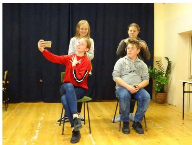
Podczas jednej z etud teatralnych.