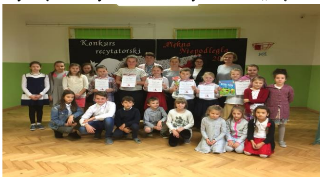
Fot. Szkolny Konkurs Recytatorski „Piękna - Niepodległa 2018”

Nowy rok szkolny 2018/2019 nasza szkoła zaczęła bardzo intensywnie. Uczniowie z wielkim zaangażowaniem uczestniczyli w obchodach 100 rocznicy Odzyskania Niepodległości przez Polskę. Z tej okazji szkoła przybrała patriotyczny wystrój. Zorganizowana została uroczysta akademie z okazji Święta 11 Listopada, a 9 listopada o godz. 11.11 cała placówka włączyła się w akcję „Rekord dla Niepodległej” i wspólnie odśpiewaliśmy cztery zwrotki Mazurka Dąbrowskiego. Dla uczczenia tej wielkiej rocznicy odbył się Szkolny Konkurs Recytatorski – „Piękna Niepodległa 2018”.