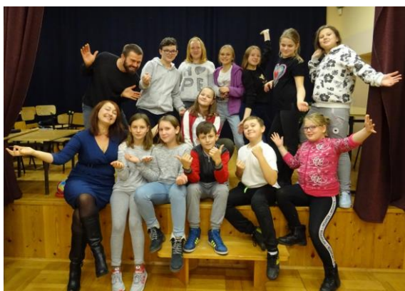
Uczniowie z aktorami Teatru Przedmieście na szkolnej scenie.

"Inicjatywa jest realizowana w ramach projektu „Podkarpackie Inicjatywy Lokalne 2018-2019” dofinansowanego ze środków Programu Fundusz Inicjatyw Obywatelskich. Regionalnymi Operatorami Projektu są: Fundacja Fundusz Lokalny SMK, Stowarzyszenie LGD „Partnerstwo dla Ziemi Niżańskiej”, Stowarzyszenie LGD „TRYGON- Rozwój i Innowacja, Fundacja Przestrzeń Lokalna”.