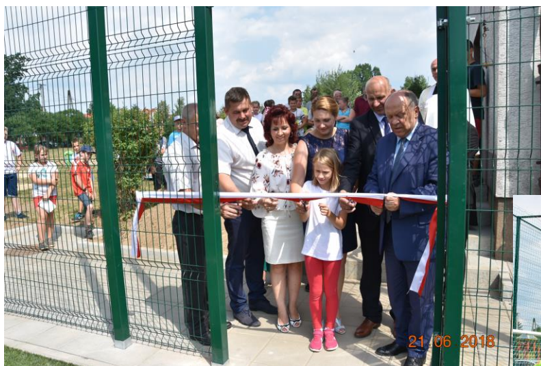
Dyrektor SP Kopcie